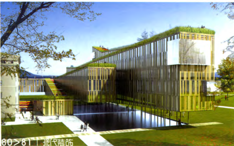
80>81 | 现代装饰

项目名称 WTO威廉拉培中心扩建 项目地址 瑞士 项目面积 12000 sq m 竣工时间 2009