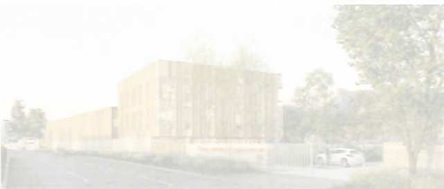
AGENCE MILK ARCHITECTES