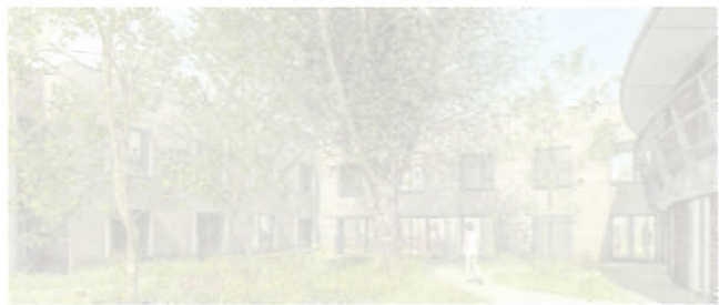
AD HOC ARCHITECTURE