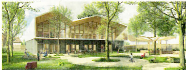
EDRICO RAIS-GATHIÈRES, GRIÉCO

➔ Opération : réalisation du nouveau musée d'histoire de la ville par la réhabilitation d'un ensemble patrimonial classé monument historique (ancienne église Saint-Pierre, ancienne église et gisement archéologique Saint-Georges et ancienne salle capitulaire de l'Abbaye Saint-Pierre) et la création d'une extension contemporaine et de liaisons entre les bâtis. Maître d'ouvrage : Département de l'Isère (Grenoble). Équipe lauréate : Atelier Novembre, architecte mandataire (Paris); Lagneau Architectes, architecte du patrimoine (Paris); NC Nathalie Crinière, muséographe, scénographe et socleur (Paris); Cartel Collections, conservation préventive (Paris); 8'18", concepteur lumière (Marseille); CL Design, graphiste et signaléticien (Paris); Relab, multimédia et audiovisuel (Lunay); CET Ingénierie, BET structure, fluides, SSI et économie (Lyon); EODD Ingénieurs Conseils, QEB (Villeurbanne); Urbalab, BET paysage et VRD (Lyon); Studio DAP, acousticien (Paris). Surface : 4 000 m 2 de surface de plancher (SP). Estimatif travaux : 20 380 780 € HT (mars 2022). Lauréat du concours : mai 2023. Calendrier prévisionnel : études, en cours; AO travaux, nov. 2024; travaux, avr. 2025 - janv. 2027; inauguration, juin 2027.